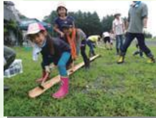
流しそうめん台をみんなで作ります