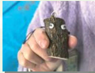
間伐した生木を使って作るクラフト (冬)