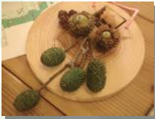
木の実を拾って作るクラフト (秋におすすめ)