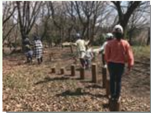
自分たちで森の中に遊び場をつくります