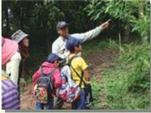
ガイドが森林や生き物のことを紹介します