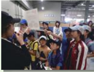
自動販売機の工場をご案内します