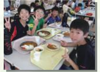
工場と森の両方を楽しみます (社食体験付き)