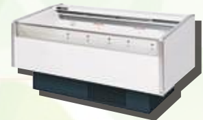
冷蔵・冷凍ショーケース