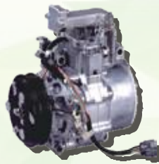
自動車用コンプレッサー