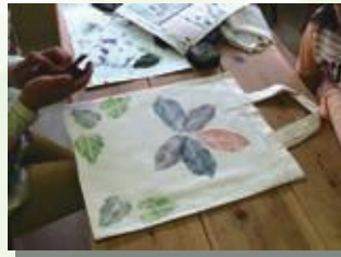
葉っぱを拾って作るクラフト (春～夏)