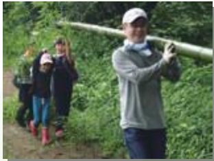
豊かな森を作る体験ができます