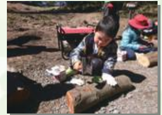
間伐した丸太にきこの種駒を打ち込みます