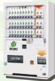
自動販売機システム