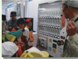
今と昔の自販機とその歴史を紹介します