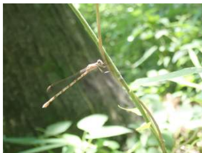
ホソミオツネントンボ 雌