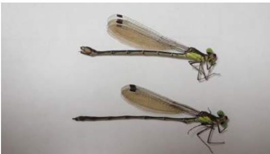
オオアイトトンボ 上雌、下雄