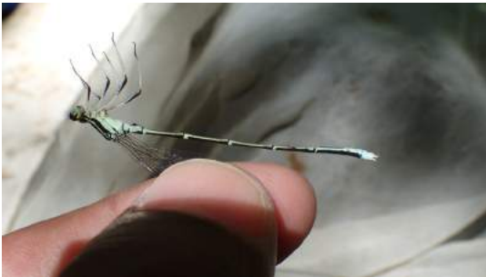
モノサシトンボ 雄