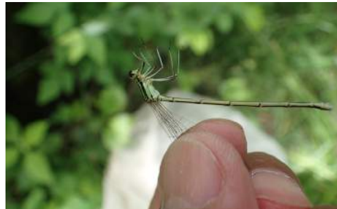
モノサシトンボ 雌