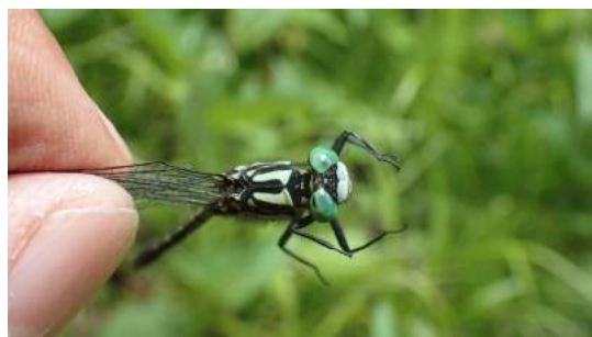
コサナエ ♂ (顔)